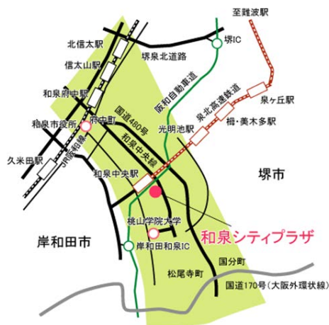
和泉シティプラザ 3階

【会場】和泉シティプラザ 3階 学習室4（泉北高速鉄道 和泉中央駅より徒歩約3分）